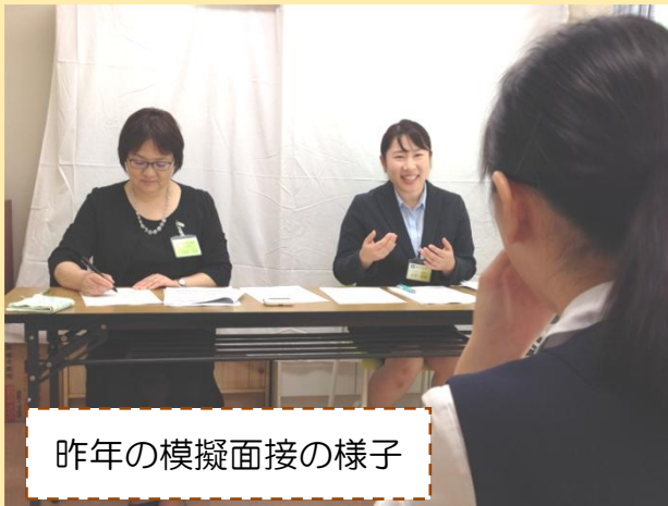
昨年の模擬面接の様子

「面接試験ってどんなことを聞かれるのか不安」「とにかく心配」「どんなことを準備したらいいの?」「面接試験の本番は目前、学校や塾での練習はしたけれど…」というあなたへ。医療機関の職員に面接してもらうことは本番に向けて大きな自信につながります。夢を実現させるための一歩を踏み出しませんか? みなさんの参加をお待ちしております。